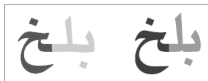
اصلاح شکل «ح» در یاقوت بُلد