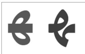
تغییر شکل «په» بد فرم اصیل آن در قلم زر بُلد