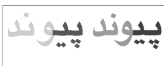
هماهنگی محل نقاط در حروف «پ» و «یا». قلم یاقوت بُلد