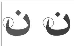
حفظ ظرافت منحنی حرف «ن» در قلم زر بُلد