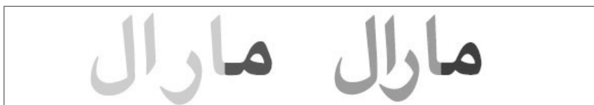
اصلاح شکل «ه» در یاقوت بُلد