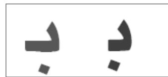
اصلاح اعوجاج زیر حرف «ب» در قلم یاقوت بُلد