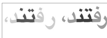
هماهنگی و موقعیت مناسب نقاط در حروف «ت» و «ن». قلم یاقوت بُلد