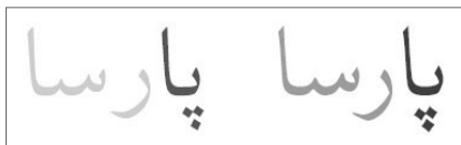
وقعیت مناسب نقاط در ترکیب «پا». قلم لوتوس