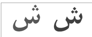
اصلاح محل قرار گرفتن نقاط حرف «ش» در قلم میترا بُلد